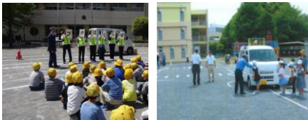
<はまっ子交通あんぜん教室>

車の危険を視覚的に伝える「死角・巻き込み・制動」実験を加えた体験型教育「はまっ子交通あんぜん教室」を開催。