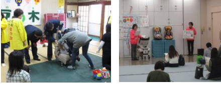
<チャイルドシート着用教室>

令和3年度は市内の小学校で、年間242回54,332名の児童を対象に開催しました。