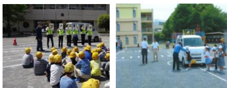
<はまっ子交通あんぜん教室>

車の危険を視覚的に伝える「死角・巻き込み・制動」実験を加えた体験型教育「はまっ子交通あんぜん教室」を開催。 令和4年度は市内の小学校で、年間257回 60,069名の児童を対象に開催しました。