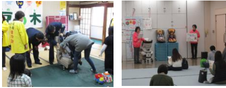
<チャイルドシート着用教室>

チャイルドシート着用の向上を図る等の「チャイルドシート着用教室」を開催。 令和4年度は市内で実施される 両親教室や乳幼児健診会場等において、年間42回 1,593名の方を対象に開催しました。