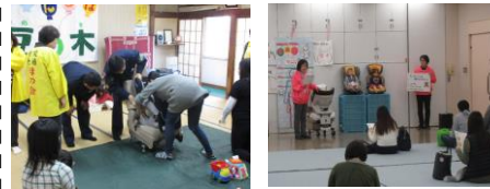
<チャイルドシート着用教室>

チャイルドシート着用の向上を図る等の「チャイルドシート着用教室」を開催。 令和4年度は市内で実施される 両親教室や乳幼児健診会場等において、年間42回 1,593名の方を対象に開催しました。