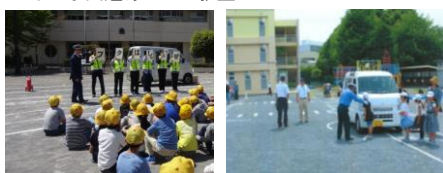
<はまっ子交通あんぜん教室>

車の危険を視覚的に伝える「死角・巻き込み・制動」実験を加えた体験型教育「はまっ子交通あんぜん教室」を開催。 令和4年度は市内の小学校で、年間257回 60,069名の児童を対象に開催しました。