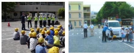
<はまっ子交通あんぜん教室>

車の危険を視覚的に伝える「死角・巻き込み・制動」実験を加えた体験型教育「はまっ子交通あんぜん教室」を開催。 令和5年度は市内の小学校で、年間272回 59,066名の児童を対象に開催しました。