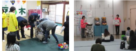
<チャイルドシート着用教室>

チャイルドシート着用の向上を図る等の「チャイルドシート着用教室」を開催。 令和5年度は市内で実施される両親教室や乳幼児健診会場等において、年間49回 2,052名の方を対象に開催しました。